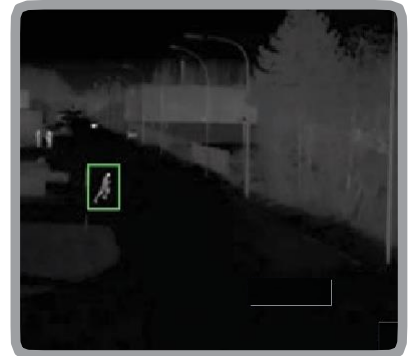
サーマル・カメラをサポート