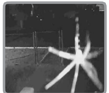
蜘蛛や昆虫によるアラームを低減