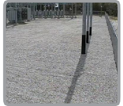
一般的なエリア向けアプリケーション