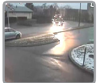
車のヘッドライトによるアラームを低減