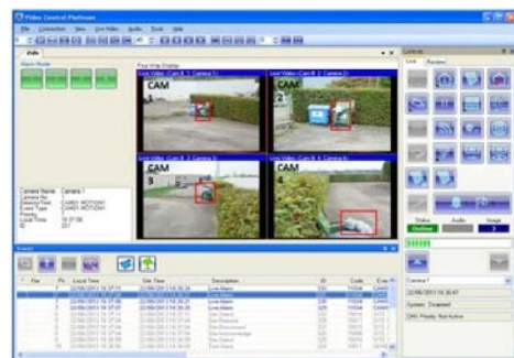
Fig.4 複数カメラの 4 分割表示

輸入販売元： フジビジョン株式会社 〒343-0015 埼玉県越谷市花田 3-3-30 Ph: (048)962-0260 Fx: (048)962-0262 Email: info@fujivision.co.jp Doc. No. 14976_08