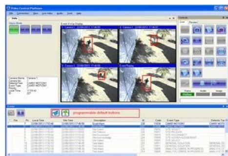
Fig.1 クイック・コメント・ボタン付き シーケンシャル 4 画面表示