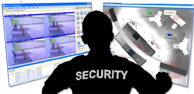
グラフィカル・サイト・マップ